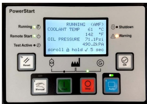
Display/pannello di controllo PowerStart 600

Nota: per ulteriori informazioni sul sistema di controllo, fare riferimento alla documentazione del prodotto PS0600.