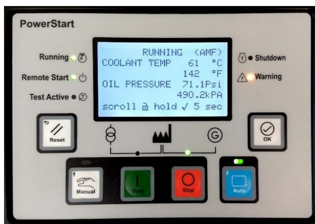
Display/pannello di controllo PowerStart 600

Nota: per ulteriori informazioni sul sistema di controllo, fare riferimento alla documentazione del prodotto PS0600.