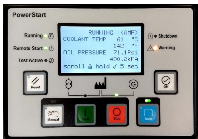
Display/pannello di controllo PowerStart 600

Nota: per ulteriori informazioni sul sistema di controllo, fare riferimento alla documentazione del prodotto PS0600.