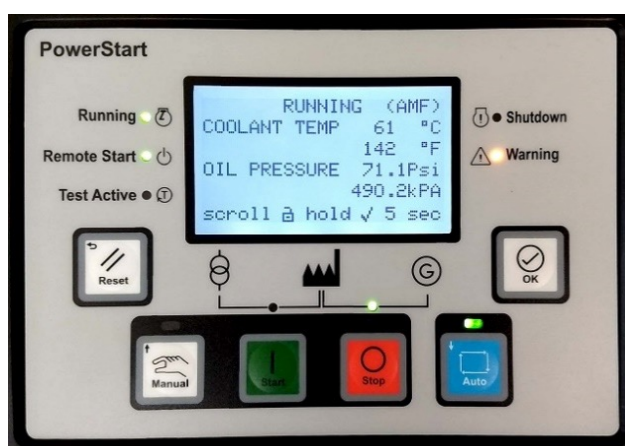
Display/pannello di controllo PowerStart 600

Nota: per ulteriori informazioni sul sistema di controllo, fare riferimento alla documentazione del prodotto PS0600.